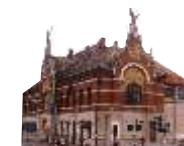
Miejski Ośrodek Kultury w Jarosławiu